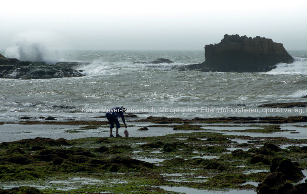
Ein typischer leicht dunstiger Himmel am Meer. Das Bild wirkt kraftlos. Blende 9, 1/500 s, ISO 200, 135 mm

Aber auch ein bewölkter Himmel profitiert vom Einsatz eines Verlaufsfilters, der die Wolkenstrukturen dramatischer hervortreten lässt. In einem solchen Fall wird der Filter parallel zum Horizont eingeschoben.