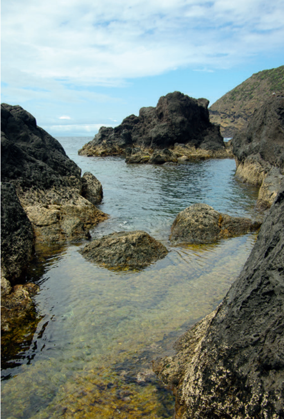
Dieses Motiv wurde ohne Filter aufgenommen. Blende 8, 1/125 s, ISO 100, 18 mm

Bedenken Sie: Je mehr Glas Sie vor Ihr Objektiv setzen, desto größer wird auch die Anfälligkeit für störende Effekte. Beugen Sie dem vor, indem Sie den Einfall direkten Sonnenlichts auf die Filter unterbinden. Manchmal reicht es dazu, mit der Hand ein wenig Schatten zu geben; besser geeignet sind ein Stück Pappe oder ein Schirm. Vielleicht können Sie auch eine weitere Person bitten, Schatten zu spenden.