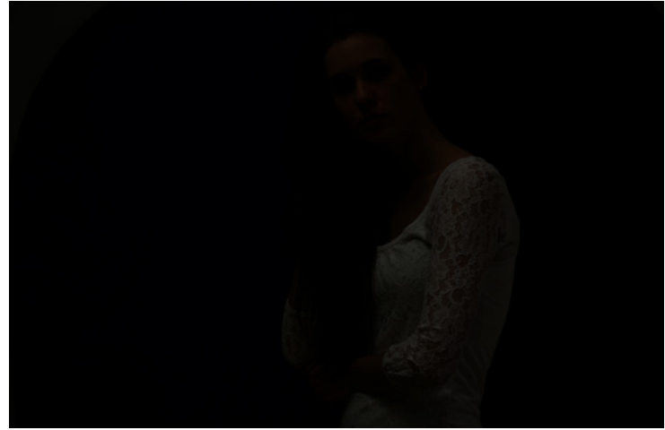
Am Anfang steht ein Testschuss, um die Unterdrückung des Umgebungslichts zu kontrollieren. Hier ist alles in Ordnung, denn trotz eingeschaltetem Raumlicht fällt die Aufnahme fast schwarz aus (daher auch »Schwarzschuss«). Canon EOS 5D Mark III · EF 70–200 f/2.8 II @ 100 mm und @ f/3,2 · M-Modus · 1/160 Sekunde · ISO 100 · JPEG · WB Blitz · Blitz ist noch ausgeschaltet

»So kurz wie möglich« bedeutet, dass Sie die Belichtungszeit nicht kürzer als die Blitzsynchronzeit zuzüglich ein wenig Sicherheit für die Funkmodule wählen (siehe Die Technik im Detail ). Sie landen damit dann regelmäßig bei 1/125 oder 1/160 Sekunde. Eine der Größen – die Belichtungszeit – können Sie entsprechend bereits abhaken. Die Blende stellen Sie wie unter Dauerlicht oder Tageslicht nach Ihrem Wunsch hinsichtlich der Schärfentiefe ein. Den ISO-Wert wiederum wählen Sie so klein wie möglich und so hoch wie nötig. Der Kompromiss hierbei: Ein hoher ISO-Wert hilft, den Blitz zu entlasten, kann aber auch das Umgebungslicht wieder störend sichtbar werden lassen.